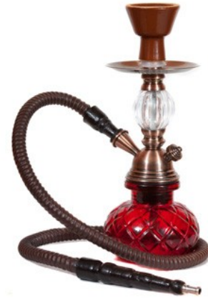
Image 1. Hookah / pipa de agua

C13. ¿Cuál de los siguientes productos de tabaco ha probado usted alguna vez?