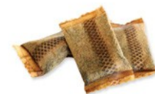
Image 3. Snus