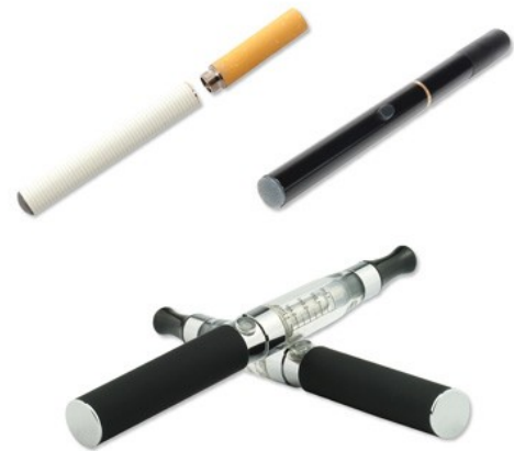
Image 2. Cigarrillos electrónicos

C14. ¿Ha usado tabaco de mascar, tabaco picado o en polvo (también llamado rapé, snus, snuff o dip), por lo menos 20 veces en su vida? Algunas marcas populares incluyen Redman, Levi Garrett, Beechnut, Skoal o Copenhagen